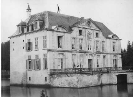
Foto uit 1870 van het kasteel zoals het er uitzag na de verbouwingen 1755-1758.

Toen de Fransen binnenvielen, emigreerde de baron naar Bremen in 1796, maar keerde in 1810 terug naar Antwerpen.