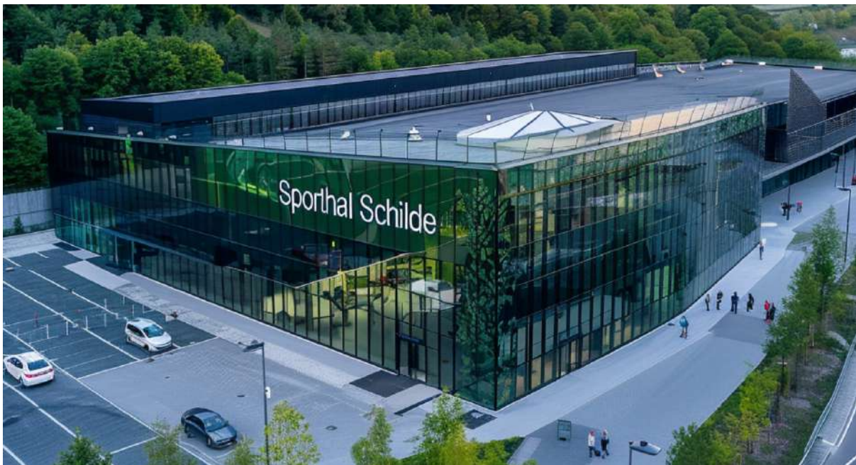
Deze foto is niet het geplande ontwerp, maar is gerealiseerd door Artificiële Intelligentie.

Zoals je in het bovenstaande verhaal over Pierre de Caters kunt lezen, de eerste Belgische vliegenier en een ware race-enthousiast, kent Schilde een geschiedenis vol sport en avontuur. Net zoals De Caters de lucht in ging, duiken onze inwoners vol enthousiasme in de vele buiten- en binnensporten die onze gemeente te bieden heeft.